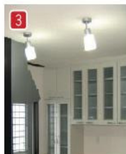
開放的な対面キッチン内は勝手口ドアとユニット収納も有り使い勝手抜群!