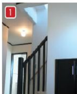
玄関を入ると豪華な御影石張りとおしゃれな階段手すりがアクセントです。