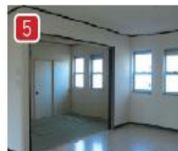
リビングと続き間の和室は扉が全てしま込めるので、広いリビングがさらに開放的になります。