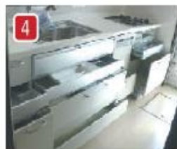
ハイグレードなシステムキッチンは使い勝手を考えたスライド扉がたくさん付いていて、料理作りがはかどります。