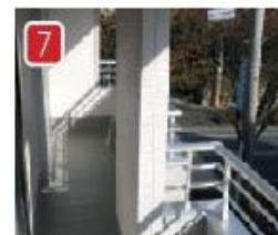
南面ワイドなバルコニーは洗濯物を楽々干せますし、便利な屋根付なので、急な雨にも困りません。