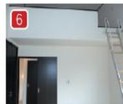
8帖の主寝室はクローゼットと4帖のロフトで収納力抜群! さらに高い斜め天井でゆとりの空間を演出しています。