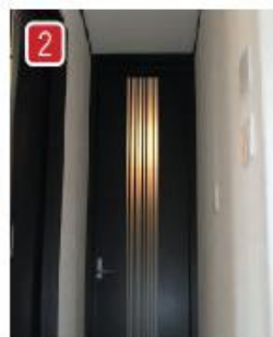
リビング入口は雰囲気の良い天井のハイドアです。さらにキッチン入口には急な来客にも困らない引戸付。